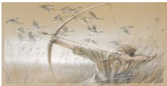
Illustration Benoit clarys

Créée par des passionnés de préhistoire, notre association a pour but de rendre la préhistoire accessible à tous. Elle propose à des musées ou toute organisme intéressé des ateliers culturels et pédagogiques actifs et des démonstrations présentant de manière vivante, par le geste et le regard, des techniques anciennes de chasse et d'allumage de feu; En outre, elle organise des manches de championnat européen de tir aux armes préhistoriques.