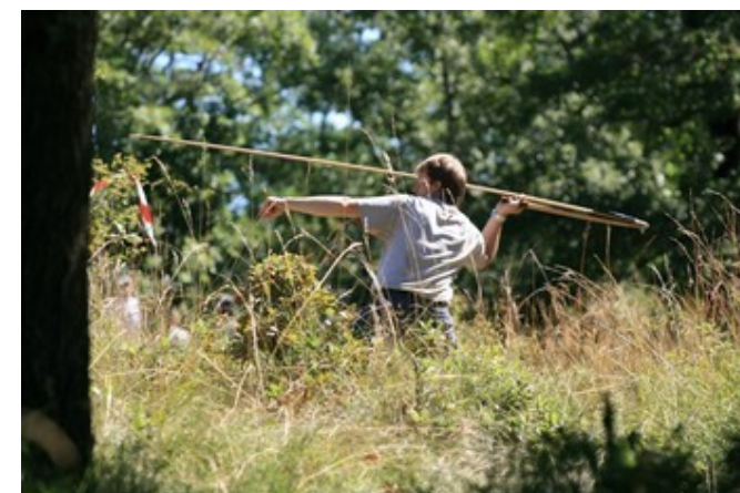
Tir au propulseur préhistorique

vous plonge au cœur de la préhistoire au travers d'animations tout public