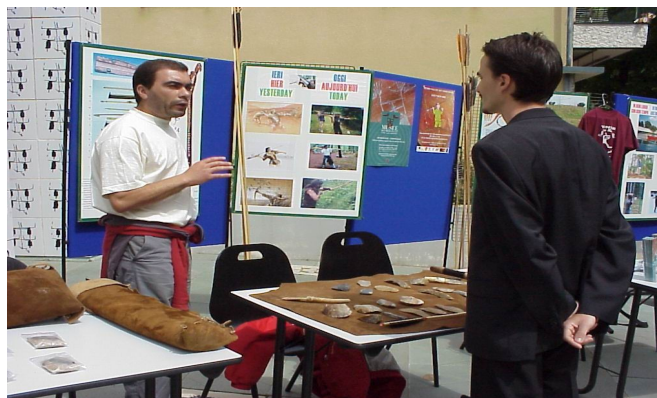
Stand d'animation parvis musée des Merveilles TENDE