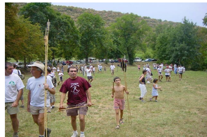
Championnat de tir MAS D'AZIL ( ARIEGE )

Ce championnat annuel a été organisé pour la première fois à la fin des années 80 par quelques préhistoriens travaillant sur les propulseurs et désireux de mieux comprendre leur fonctionnement et leur performance. Il regroupe aujourd'hui, autour d'une vingtaine d'épreuves sportives réparties à travers l'Europe, plus de huit cent compétiteurs, archéologues professionnels et amateurs passionnés.