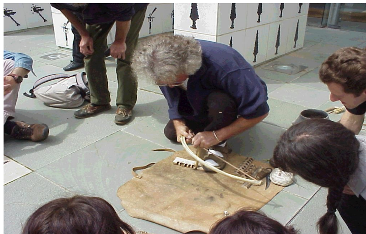
Démonstration de techniques d'allumage du feu- musée des merveilles

Démonstration de techniques d'allumage du feu