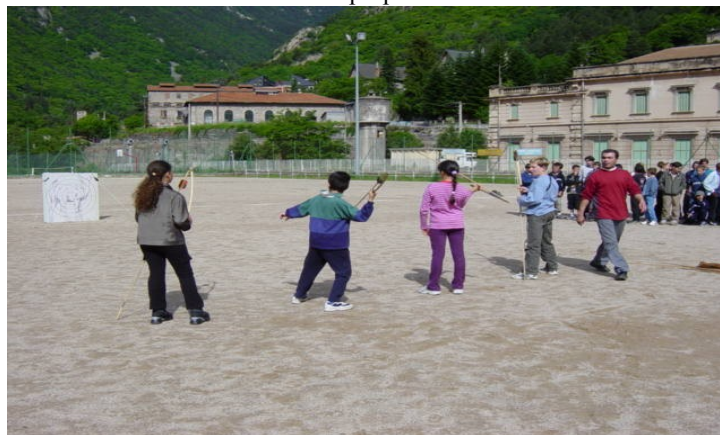
Animation de tir au propulseur Ecole primaire de Tende

Initiation de tir au propulseur sur cible