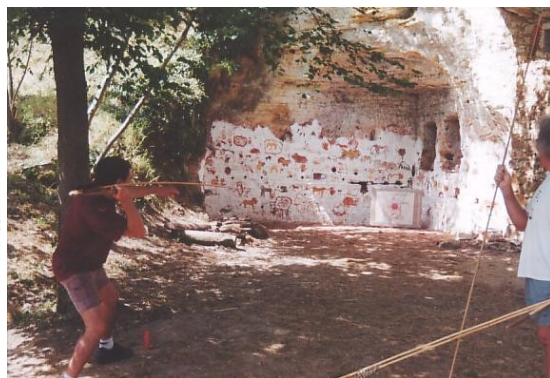
Championnat de tir LE GRAND PRESSIGNY